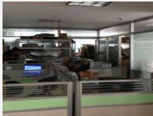
YP義烏金福源 (定員2名)