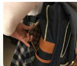
モデル使用撮影写真例