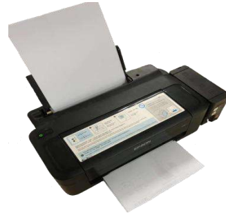
EPSON製インクジェットプリンター