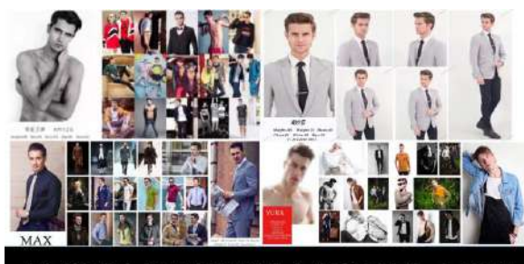
WORLD WIDE MODEL LIST