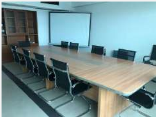
YP義烏物流センター (定員18名)