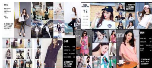
CHINESE MODEL LIST

※こちらの費用とは別途上記撮影費用を申し受けます。 ※プロモデルは都度見積りとなり、交通費も発生する場合がございます。 上記費用は目安です。ご希望の場合は担当者へ見積りをご依頼ください。