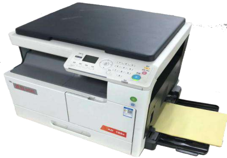
オーロラ製レーザープリンター

A4コピー紙使用の印刷やシール台紙使用のFBAラベルも共通で月100枚まで無料です。 白黒印刷はレーザープリンター、カラー印刷はインクジェットプリント使用ですが、一般的 なオフィス用印刷機ですので仕上がりを良くされたい場合は社外での印刷をご依頼ください。